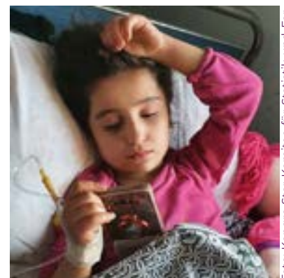
Qamishlo, 30.10.2019