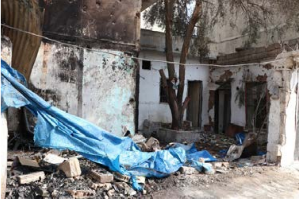
Qamishlo, 29.10.2019